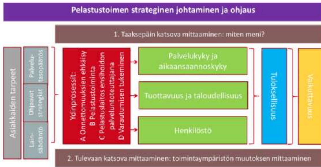
Kuva 3. Mittarikartta pelastustoimen kansallisen mittarimuodostuksen havainnollistajana