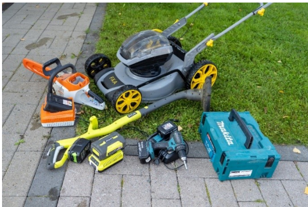
Kuva 1. Litiumioniakuilla varustettuja työkaluja.

Akustojen koko vaikuttaa palojen voimakkuuteen, mutta suurempien akustojen palot ovat harvinaisempia kuin pienten ja keskisuurten akkujen. Pienet ja keskisuuret akut säilytetään ja ladataan usein samoissa tiloissa ihmisten kanssa, minkä takia ne aiheuttavat vakavampia onnettomuuksia.