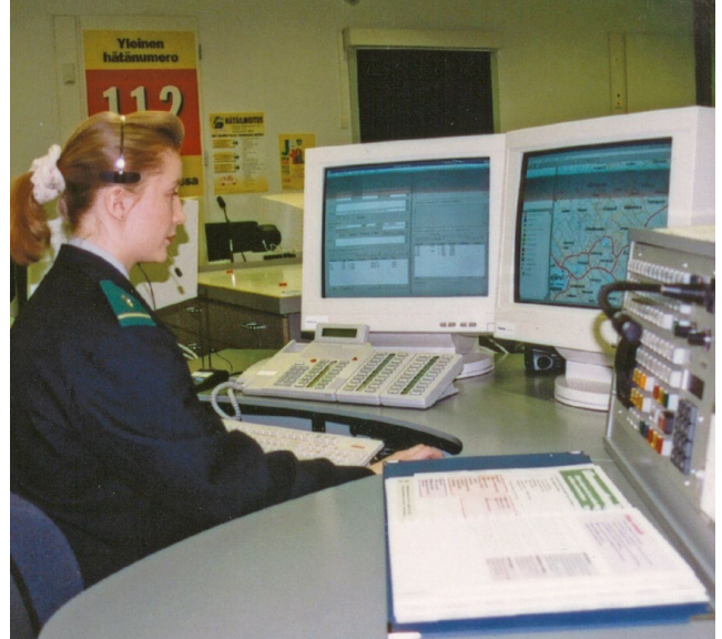
Hätäkeskuspäivystäjäkurssien alkaessa vuonna 1997 otettiin käyttöön suomalainen ensihoidon riskinarvio-ohjeistus, joka toi tullessaan keskeisen muutoksen hätäpuhelun käsittelyn toimintamalleihin. Käytössä oli sininen riskinarvio-ohjekansio, joka näkyy kuvassa päivystäjän pöydällä.

– Ohjeesta tehtiin sittemmin ihan virallinen Pelastusopiston julkaisu.